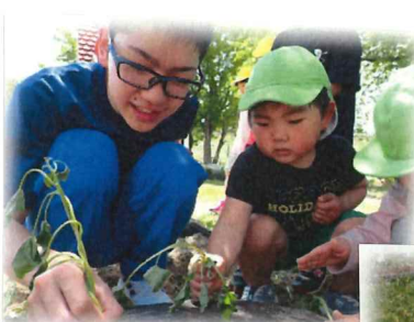
↑ サツマイモの苗はななめに植えるんだよね〜♀

ハロウィン用におばけかぼちゃの種もまいてみました。「はやく大きくなるかな〜」と、子ども達は毎日楽しみにジョウロで水をやっています♪ 尚、収穫までの過程はクラスの栽培活動表に載せています。