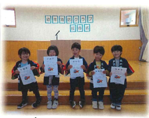
← 任命証をいただきニッコニコの4歳児♡