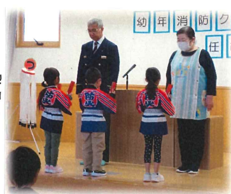
拍子木のリズムもバッチリ♡