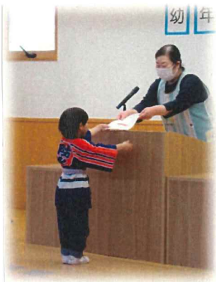
いっほい代表をつとめてくれました。

子ども達も園庭に落ちている桜の実は梅の実は見つけると「いっほいあるぞ〜」とビニール袋に入れてお土産にしたり、砂場遊びに使用しています。虫さがしても、誰が見つけたダンゴムシが一番大きいか?! 比バコしているさくら組です。