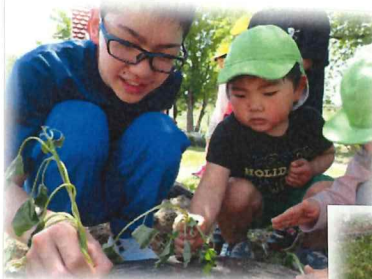
↑サツマイモの苗はななめに植えるんだよね〜♀

ハロウィン用におばけかぼちゃの種もまいてみました。「はやく大きくなるかな〜」と、子ども達は毎日楽しみにジョウロで水をやっています♪尚、収穫までの過程はクラスの栽培活動表に載せています。