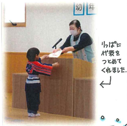
りっぱな代表をつとめてくれました。

園庭の木々があざやかな緑に染まり、新緑の季節となりましたね。 子ども達も園庭に蒔かれている桜の実や梅の実を見つけると「いっぱいあるぞ〜」とビニール袋に入れてお土産にしたり、砂場遊びに使用しています。虫さがしても、誰が見つけたダンゴムシが一番大きいか?! 比べっこしているさくら組です。