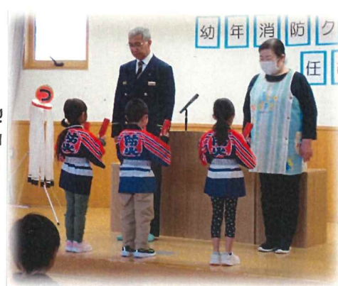
← 拍子木のリズムもバッチリ♪