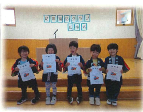
任命証をいただきニッコニコの4歳児♡