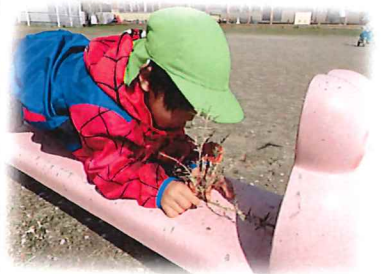
月刊絵本のひろく★ 葉っぱのいろ