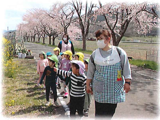
↑ 線路沿いの桜並木を見に 散歩に出かけましたよ