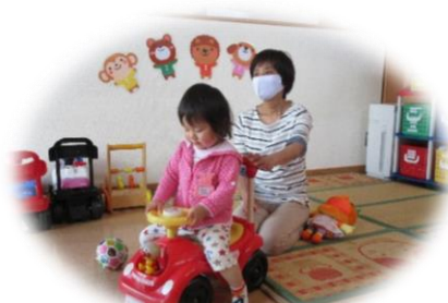
ぶっぶ～前に進みま～す!