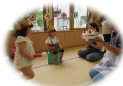
誕生日会♪おめでとう!