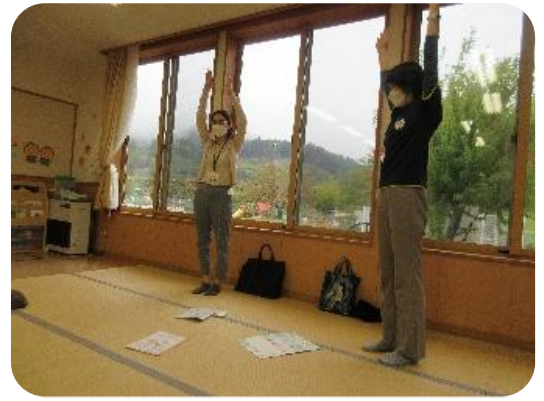
お話しの間、体をのびのび〜♪ ストレッチって気持ちいいね☆

食事や睡眠・運動の大切さについて、 保健師さん・栄養士さんに分かりやすく お話しいただきました(o^ー^o)♡