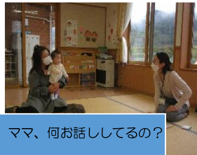
ママ、何お話ししてるの？