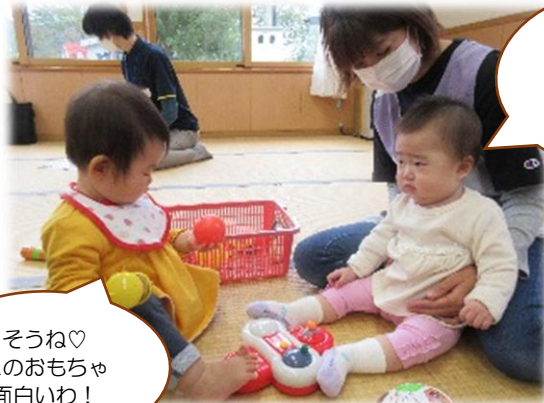
そうね♡ このおもちゃ 面白いわ！